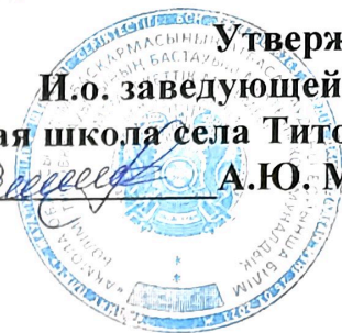
График питания учащихся в школьной столовой на 2023-2024 учебный год